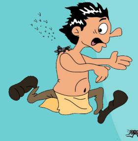
8-Arve - Langostas