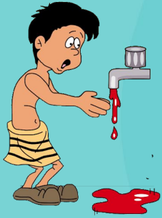
1-Dam - Sangre