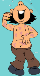
6-Shjin - Lepra