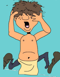
3- Kinim - Piojos