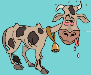
5-Dever - Enfermedades Contagiosas